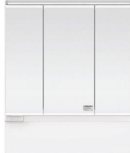
スリムLED3面鏡 ミドルパネル